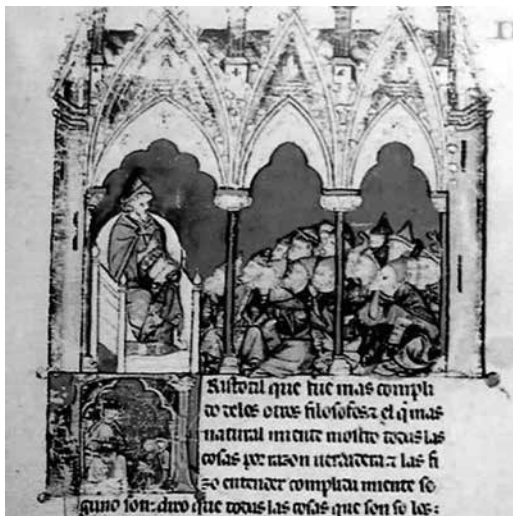
Lapidario , BE, ms. h.I.15, f. 1r.

Libro de las formas e imágenes (BE, h.I.6) –ya que tanto esta como el primer tratado del Lapidario comparten materia, fuente y la mención del sabio Abo-lays–, obra que, según reza en el prólogo, se comenzó en 1276 y se concluyó en 1279 8 .