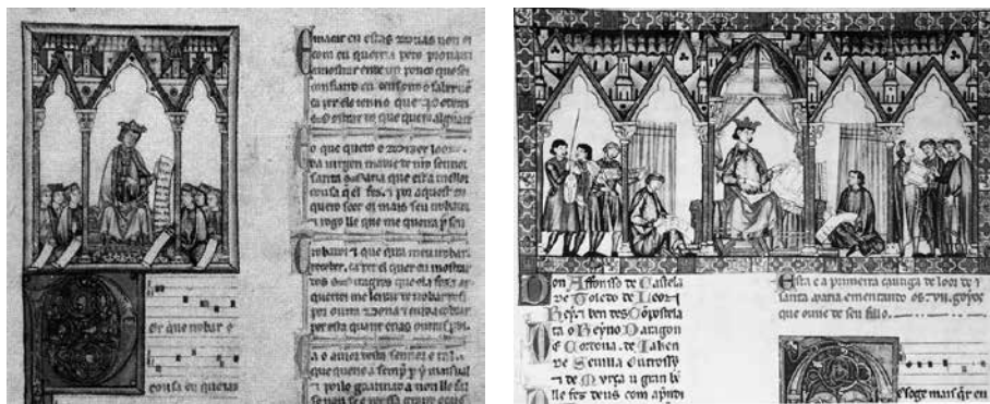
Códice Rico , BE, ms. T.I.1, ff. 4v y 5r.