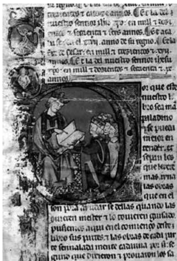
Libro de las formas y las imágenes , BE, ms. h.I.16, f. 1r.

No puede pasarse por alto que la escena se halla en la mayúscula que principia la declaración de intenciones del rey, inicial que, asimismo, marca en el texto y figurativamente resalta y enfatiza el paso de la tercera persona a la voz del rey –primera del plural–. El monarca con el códice en la mano y asistido por sus colaboradores señala claramente, con el dedo índice inhiesto, una página del libro. Aunque se ha considerado habitualmente una imagen de presentación del ejemplar a su promotor, a mi juicio –como en el Lapidario –, responde a un claro ejercicio de relación texto-imagen: «Por que este nuestro libro sea más paladino y se pueda mejor entender y sepan los que leyeren más aína las obras que en él son pora ayudarse d'ellas [...] pusiemos