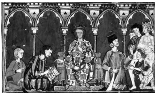
Libro del ajedrez, dados y tablas , BE, ms. T.I.6, prólogo Libro de los dados , f. 65r.