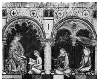
Libro del ajedrez, dados y tablas , BE, ms. T.I.6, f. 1r.

Ilustrando el prefacio se incorporan tres miniaturas que, como puede observarse seguidamente, además de los paralelismos visuales, enlazan la labor del rey indio y sus sabios consejeros (imagen tercera) con la de Alfonso X y sus amanuenses (imagen primera) y el vínculo de unión es la estampa del scriptorium (imagen segunda). En las imágenes del Libro del ajedrez, dados y tablas , la simbología del libro es subsumida por el emblema de la labor de traducción, creación, y manufactura de todos los proyectos librarios regios: el taller alfonsí.