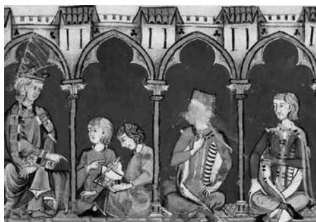
Libro del ajedrez, dados y tablas , BE, ms. T.I.6, prólogo Libro de las tablas , f. 72r.

No obstante, hay que advertir que estamos ante una variación del modelo. Alfonso X aparece en las tres ilustraciones en actitud de dictar al escriba, que con la pluma en la mano copia las palabras de su interlocutor; bien puede pensarse que se trata de los prefacios –muy escuetos en los dos últimos libros– en los que la presencia del rey queda manifiesta por la primera persona del plural 29 . Nótese que estas imágenes son las únicas en las que el rey no contempla o porta el ejemplar del libro –como resultado final de un proceso concluido–, por tanto, no sería aventurado argüir que estas miniaturas concretan la fase de composición y denotan una acción en progreso que se corresponde con las propias palabras de Alfonso X en los proemios: «fabla en este libro primera- mientre d'él [ajedrez] (f. 2v), «queremos agora aquí contar de los juegos de los dados» (f. 65r) y «queremos agora aquí fablar de las tablas» (f. 72r); un «agora» que fusiona el presente textual e icónico.