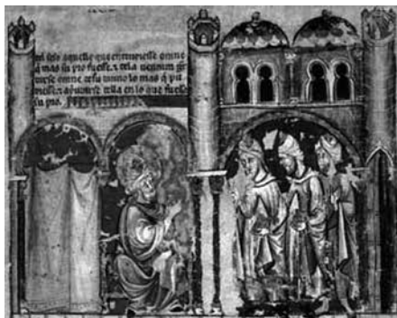
Libro del ajedrez, dados y tablas, BE, ms. T.I.6, f. 2r.