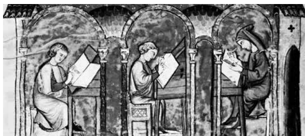
Libro del ajedrez, dados y tablas , BE, ms. T.I.6, f. 1v.