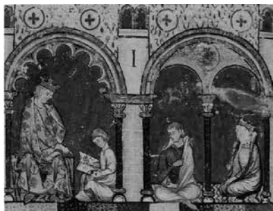
Libro del ajedrez, dados y tablas , BE, ms. T.I.6, prólogo general y prólogo Libro del ajedrez , f. 1r.