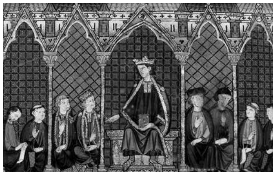
IV Parte General Estoria , Roma, Biblioteca Apostólica Vaticana, ms. Urb. Lat. 549, f. 2v.