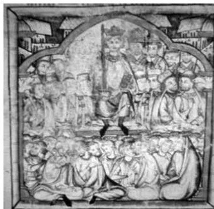
Primera Partida , Londres, British Library, Add. ms. 20787, f. 1r.

iconográficas y estilísticas que sugieren una cronología más tardía» 19 .