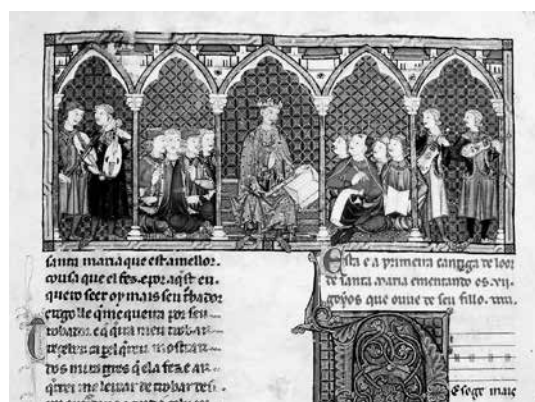
Códice de los Músicos , BE, B.I.2, f. 29r.

El centro privilegiado de estas miniaturas lo ostenta el rey con el libro, siguiendo el modelo ya delineado en las compilaciones científicas –como hemos visto en páginas anteriores–. El volumen es el resultado del proceso de composición intelectual y material y, al tiempo, es la base de la ejecución musical y vocal.