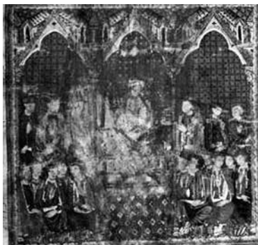
Estoria de España , Madrid, Biblioteca de El Escorial, ms. Y.I.2, f. 1v.