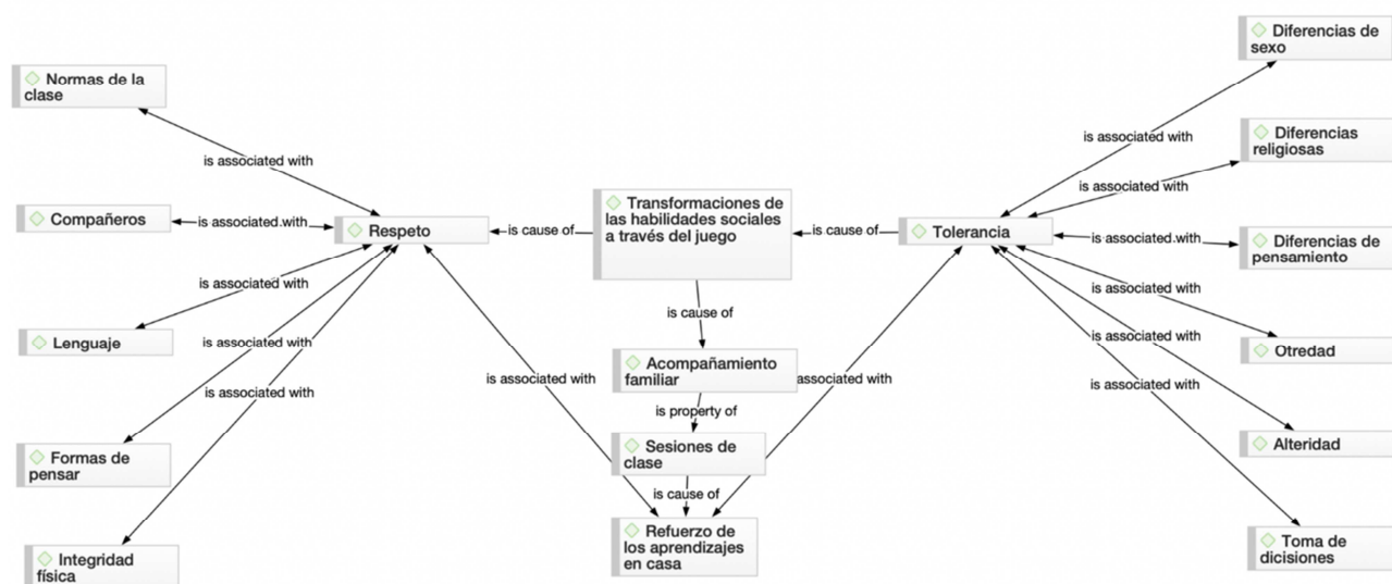
Figura 3. Aportes del programa sobre el desarrollo de habilidades sociales.

El acompañamiento de los padres de familia tuvo un plus especial durante el proyecto, pues ellos tuvieron la posibilidad de reconocer el programa y potenciar los aprendizajes en casa, fomentando la comunicación asertiva, el desarrollo de normas y el respeto de estas, las cuales fueron fundamentales durante el desarrollo de las unidades didácticas. Los padres reforzaban el lema, primero se forman a los seres humanos y luego a los deportistas.