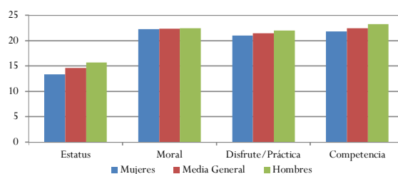
Figura 4. Gráfico medias generales por sexo de las dimensiones valóricas.

Los resultados señalan (ver figura 4 y tabla 3) que entre todos los estudiantes (chilenos y extranjeros) el valor «estatus» es el menos señalado por hombres y mujeres con 14.6 puntos. Mientras que «competencia» y «moral» son los valores que más destacan con puntajes que sobrepasan los 22 puntos de media, aunque en ambos casos los hombres presentan puntajes mayores que las mujeres.