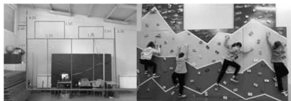
Figura 3. Diseño inicial del rocódromo y su puesta en práctica

En la fase final de construcción se han colocado dos reuniones, ancladas a las vigas del pabellón y coincidiendo con los tablones de mayor altura. Posteriormente, con la colaboración de las maestras de la etapa de Educación Infantil del centro, se han pintado los tablones y las presas para dotarle de un mayor atractivo para el alumnado.