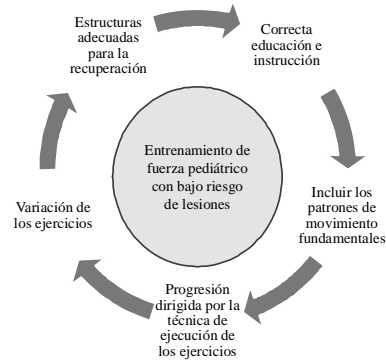
Gráfico 1. Variables a considerar por el especialista en fitness infantil en el diseño de un EFP para reducir el riesgo de lesiones. Tomado del original Myer et al., (2011).

Finalmente, cabe subrayar que los principales riesgos de lesión del EFP derivan, por norma general, de errores en el diseño del entrenamiento (por ejemplo, demasiada carga, demasiado pronto) y de una inadecuada supervisión o instrucción por parte del especialista en fitness infantil (Myer et al., 2011).