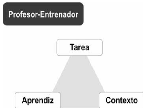
Figura 1. Representación gráfica de los condicionantes que interactúan (del individuo, la tarea y el contexto) durante la emergencia de comportamientos de juego en el deporte. El papel del profesor-entrenador será el de controlar y manipular éstos condicionantes basándose en la evaluación de las necesidades individuales y del grupo.

Desde esta idea el rendimiento de un sistema dinámico (por ejemplo un jugador de fútbol) para realizar una habilidad concreta como un