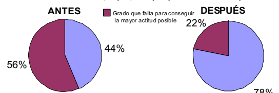
Figura 4. Valoración de la satisfacción, opinión y mejora en sujetos expuestos al método de enseñanza socialización (Grupo 2) antes y después de las sesiones impartidas.