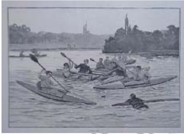
Figura 1. Imagen de The Graphic 1884

En 1986, la Federación Internacional de Piragüismo (International Canoe Federation), publicó su primer borrador del reglamento oficial, realizándose el primer torneo de exhibición en 1987 en Duisburg (Alemania) simultáneamente al Campeonato del Mundo de Aguas Tranquilas. El primer reglamento oficial fue finalizado en 1990 y el primer Campeonato del Mundo de Kayak Polo se celebró en Sheffield (Inglaterra) en 1994, con una participación de 16 países en la categoría masculina y 6 en la femenina.