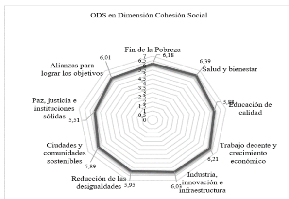
Figura 2. ODS en Dimensión Cohesión Social. Rango de puntuación=1-7

La Tabla 12 identificó la incidencia de ciertos impactos de la dimensión Bienestar y su relación con determinados Objetivos de Desarrollo Sostenible (ODS). Impactos como el aumento de precios, dificultades de acceso a espacios públicos, alteraciones en la vida diaria y daños al medio ambiente (Tabla 12).