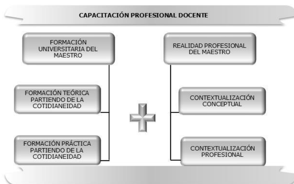
Diagrama 1: Capacitación profesional del maestro.

Para que el estudiante de maestro adquiriera la competencia científica ha de tener no solamente un conocimiento del contenido, sino también un conocimiento didáctico del mismo, ello comporta no solo saber situarse en un paradigma determinado de trabajo, sino conocer la teoría en la que está trabajando y articular modelos adecuados, que permitan establecer la relación entre teoría y práctica. Pero no queda aquí el proceso de habilitación profesional, orientado hacia la práctica. Es necesario, además, que el futuro maestro conozca el mundo que se genera en el aula, estableciendo relaciones, mediante una reflexión crítica, entre lo que conoce y su aplicación más adecuada a lo que sucede en el ejercicio de la actividad docente, actividad que no sólo se genera en las aulas, sino también en el resto de dependencias de que consta un centro educativo.