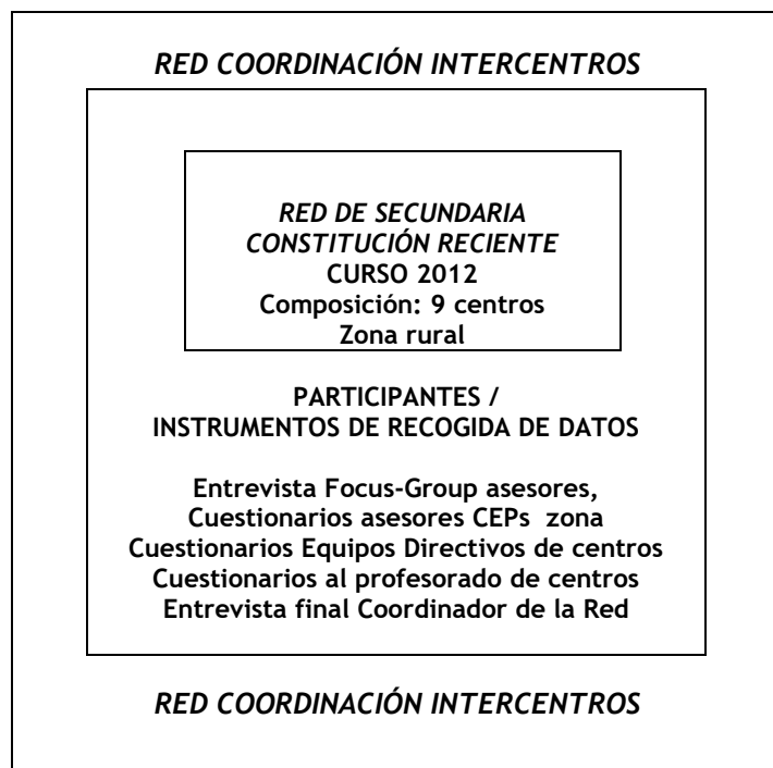
Figura 1. Datos de la Red de Coordinación Intercentros.

En la figura 1 se presenta un esquema de los participantes e instrumentos de recogida de datos de la “Red de Coordinación Intercentros”: