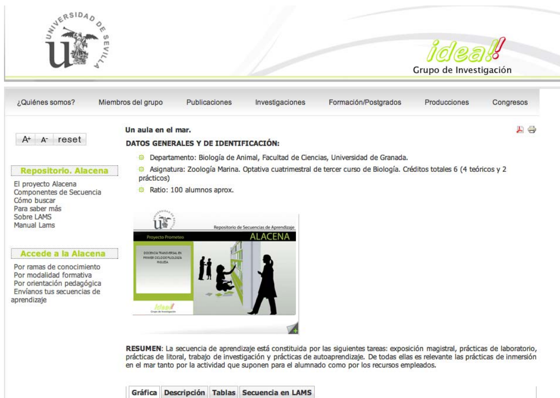
Figura 1. Alacena: Repositorio de Secuencias de Aprendizaje

realizado análisis de contenido de las entrevistas desarrolladas. A partir de los datos categorizados hemos aplicado análisis estadísticos para profundizar en los resultados alcanzados.