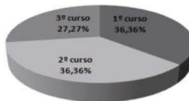
Gráfico 2. Distribución de la muestra por curso .

protocolo o guión de sesión, preparación de preguntas estímulo del tema objeto de estudio; selección de los participantes y tamaño del grupo; selección del recurso técnico para el registro de la sesión, elección del territorio y estimación del tiempo de duración de la sesión.