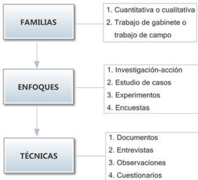
Figura 1. Niveles de concreción en el diseño metodológico de una investigación (según Blaxter, Hughes & Tight, 2005).

lidad de investigación de corte cuantitativo y basado en un trabajo de campo. Por extensión, se ha seguido un enfoque metodológico semiexperimental , según el cual se puede estudiar el efecto de materiales curriculares o métodos de enseñanza en varias clases o colegios que no están asignados de forma aleatoria. Sin embargo, «es posible administrar un tratamiento experimental a algunas de las clases y considerar a las otras como controles» (McMillan & Schumacher, 2005, p. 41). Y este es el caso que nos ocupa, al elegir el profesor-investigador a los alumnos del curso 2013-2014 para probar el efecto de la utilización de dispositivos móviles en la mejora interpretativa de los mismos (grupo experimental), comparando sus resultados con los alumnos que no utilizaron ningún tipo de tecnología (grupo control). Por último, entre las técnicas utilizadas para la recogida de datos