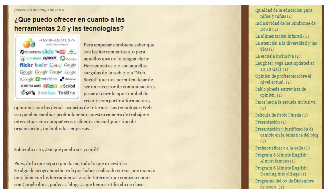
Figura 1. Blog de alumno BPE.

2. Los blogs no son la única herramienta o