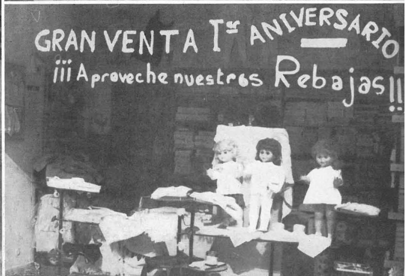
Imagen: El Gran San Blas.