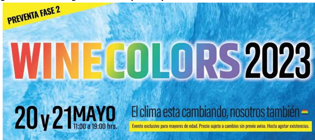
Figura 3. Marketing establecido por empresas vitivinícolas.