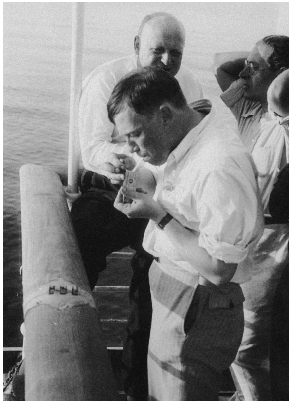
➤ Otto Neurath (detrás) camino de Atenas, durante el viaje por el mediterráneo que tuvo lugar en el Congrès Internationaux d'Architecture Moderne (CIAM) de 1933.

Parece que hubo cierta amargura en los años finales de Neurath. Se sentía despreciado por sus colegas del Círculo de Viena y reducido a un papel de organizador que desconocía sus aportaciones teóricas (Reisch, 2005: 204-207). La solidez del compromiso político de Neurath, además de su idiosincrasia, quizá fueran molestas en el forzoso aggiornamento que el macartismo impuso a la filosofía del Círculo de Viena. Hoy, sin embargo, la filosofía analítica conoce un giro político en el que Neurath podría jugar el papel de inspirador de una tradición relativamente oculta (Broncano, 2020; Pinedo y Villanueva, en prensa). En cualquier caso, esperamos que este número monográfico ayude a situar su figura en una práctica de la filosofía y las ciencias sociales donde el rigor no se encuentre reñido con el compromiso emancipatorio. Un lugar donde siempre debió haber figurado.