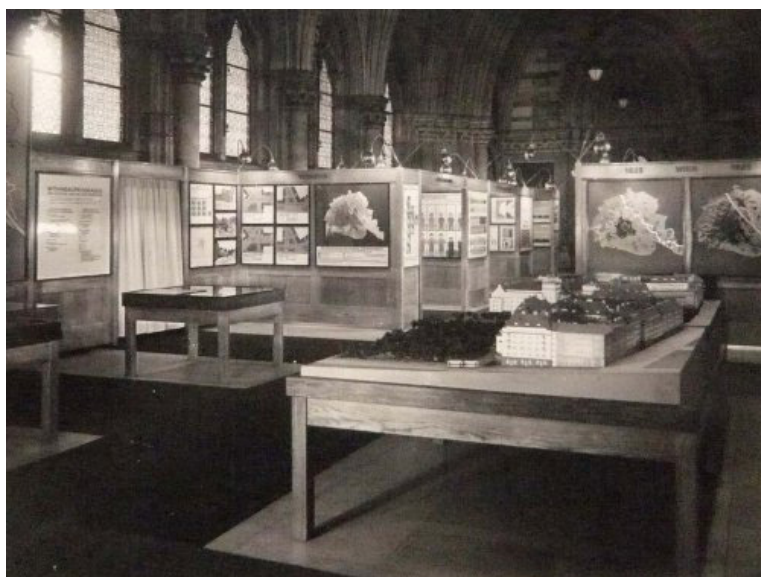
↵ Vista del Museo de Economía y Sociedad en el Ayuntamiento de Viena, alrededor de 1925.

El desarrollo del sistema ISOTYPE fue un ejemplo sofisticado de distribución social del saber. Como el enunciado protocolar, las imágenes del ISOTYPE promovían el pluralismo teórico —aunque, muy importante, con fundamento empírico— y permitían enriquecer el debate democrático. El desarrollo de este sistema permite transformar la información factual en lenguaje gráfico para mostrar las realidades socioeconómicas como un conjunto de elementos concretos y tangibles. Esta aproximación es, desde luego, reduccionista. Deja fuera la comprensión del sentido de la acción, el universo de los discursos o de las motivaciones. Esto es, el ISOTYPE deja al margen buena parte de la elaboración teórica de las informaciones, porque su objetivo es situarse allí donde el conocimiento todavía permite agrupar un máximo de perspectivas distintas. Su función, más que la explicación precisa de las dinámicas sociales, es posibilitar —en cuanto a "lenguajes de las cosas"— que puedan ser leídos por cualquiera y facilitar la comunicación entre el sistema de la ciencia y la sociedad: "Las palabras separan, las imágenes unen".