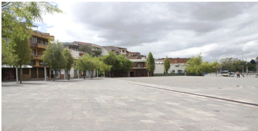
Figura 2. Plaza del Otorongo en un día cotidiano