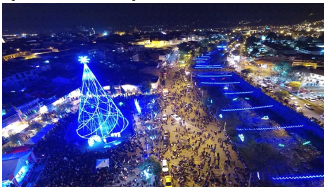
Figura 3. Plaza del Otorongo con la estructura del árbol de Navidad