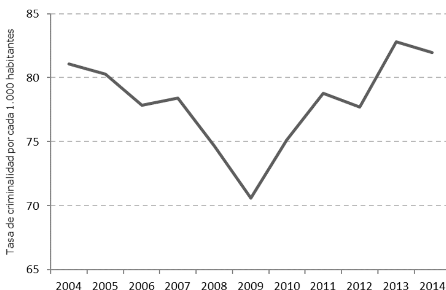
Gráfico 2. Tasa de criminalidad registrada por el Cuerpo Nacional de Policía en el Distrito de Salamanca, 2004-2014.

Fuente: Elaboración propia a partir de los datos cedidos por la comisaría de Distrito.