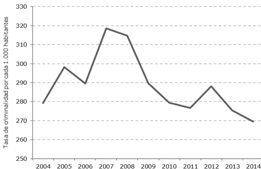
Gráfico 1. Tasa de Criminalidad registrada por el Cuerpo Nacional de Policía en el Distrito Centro, 2004-2014.

Fuente: Elaboración propia a partir de los datos cedidos por la comisaría de Distrito.