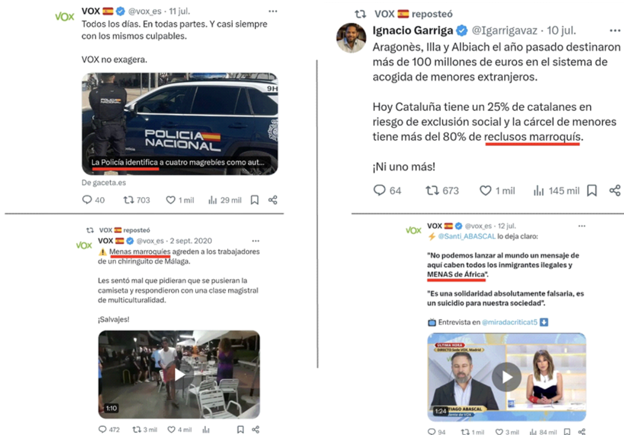
Imagen 1. Uso de etnónimos, circunloquios etno-referenciales y topónimos etno-culturales.

último, en una ocasión —en todo el periodo analizado— se habla de “jonvenlandeses” 3 , y en otra se menciona a “un hondureño” que ha cometido un delito. No existen más identificadores textuales en los datos analizados. Veamos algunos ejemplos en la Imagen 1.