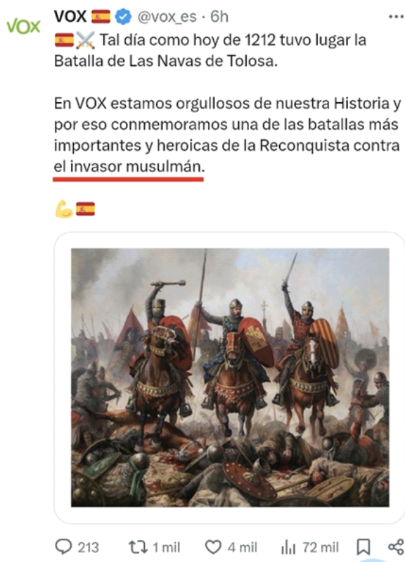
Imagen 4. Representación de “el musulmán como invasor”.