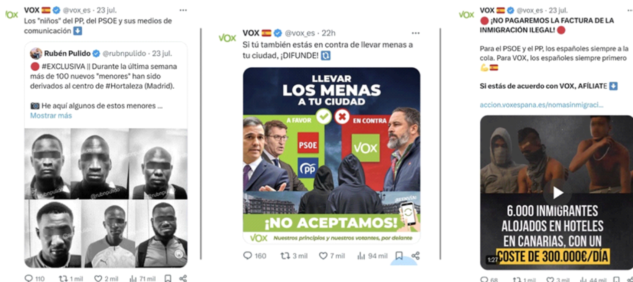
Imagen 2. Uso de imágenes racializantes.

la cuenta oficial vuelve a publicar posteriormente, en reiteradas ocasiones, con el consiguiente efecto de “verdad ilusoria” que ello puede conllevar. Se trata, por lo tanto, de imágenes idénticas que aparecen de forma repetitiva a lo largo de todo el periodo observado, una y otra vez.