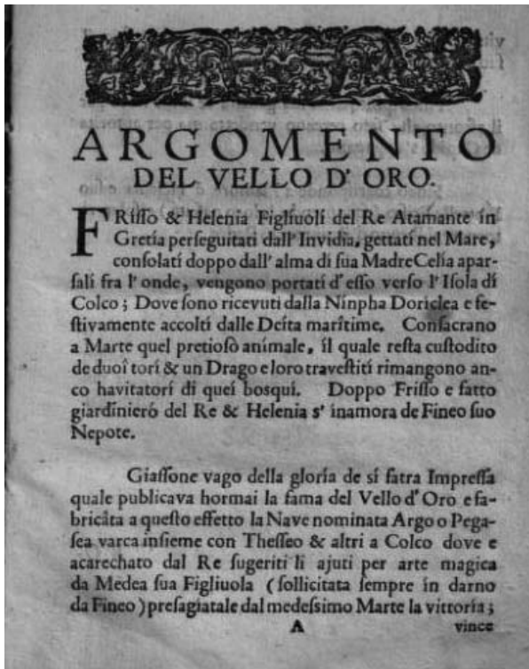
Portada del «Argomento del Vello d'Oro» (fol. A 1 ), Ejemplar ubicado en la Biblioteca Nacional de Austria, signatura *38.F93

da o tal vez obligada a demostrar a su esposo y a la corte imperial que las fiestas cortesanas españolas no desmerecían en nada a las de Viena» 35 . De esta fiesta novedosa se conserva un impreso con el texto de la comedia y los entremeses, que viene precedido por un resumen por escenas del contenido de la loa y de la obra en italiano 36 . Ese resumen que abre el volumen lleva el título «Argomento del Vello d'Oro» y presenta lo que parece un papel distinto y menos rico en ornamentación que el del papel que recoge el texto de la comedia. Da la impresión de que se imprimieron por separado, pues aparecen dos numeraciones distintas. El «Argomento» consta de 6 folios de texto (signaturas A 4 , B 2 ).