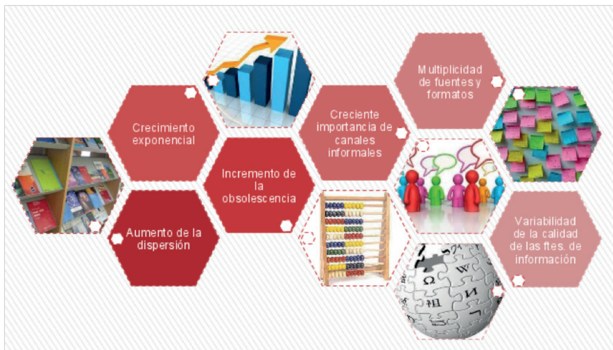
Figura 1. Características de la información científica en la actualidad

tal como demuestran algunos datos estadísticos de Rebiun durante el período 2012-2016 (figura 2).