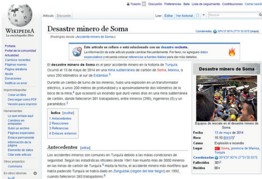
Figura 2. Aspecto de un artículo con la plantilla Evento actual para desastres o accidentes, que se inserta en Wikipedia con el código {{evento actual|desastre}}.

La comunidad de Wikipedia ha elaborado políticas y pautas para lidiar con este tipo de artículos, en los que hay una serie de problemas recurrentes que se pueden evitar desde la experiencia y con algo de atención.