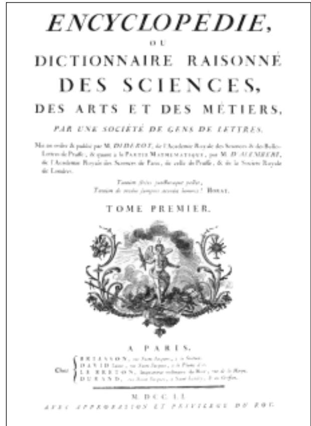
Portada de la edición original de la Encyclopédie (1751).

En segundo lugar, emplea software comunitario, abierto para los diseños y el mantenimiento del sistema. El mecanismo que posibilita que la nueva información sea accesible de forma inmediata (además de