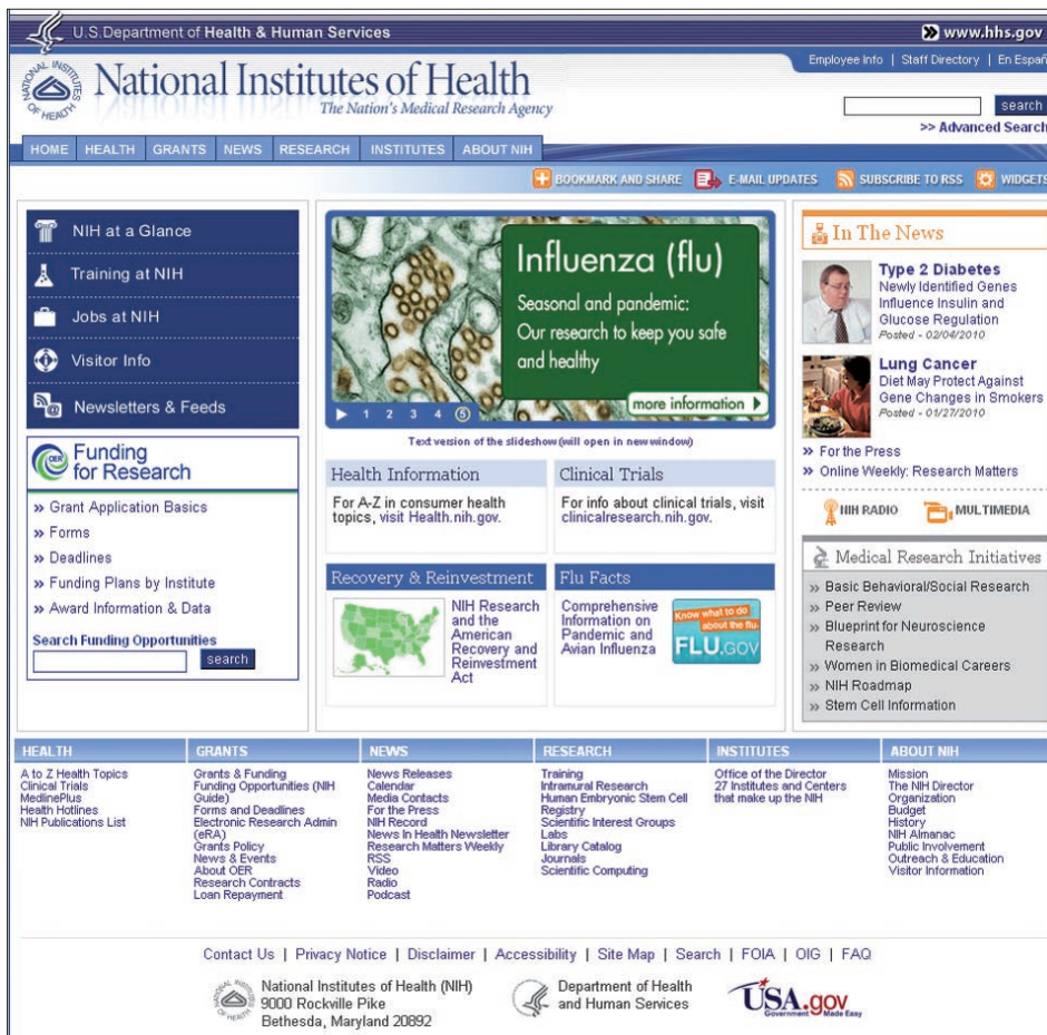
Figura 2. National Institutes of Health, http://nih.gov/