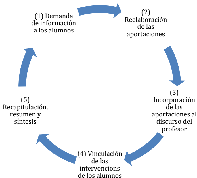
Estrategias discursivas utilizadas por el profesor durante las actividades de reflexión

Tal y como podemos ver, primero la profesora hace una demanda de información explícita a los alumnos a partir de preguntas directas para obtener información sobre el tema que están tratando (1), la profesora toma la palabra después de la intervención del alumno, y en su intervención responde, parafrasea, expande, corrige, etc. las aportaciones de éste (2) integrándolas a su propio discurso (3) y vinculándolas a otras aportaciones del resto de los alumnos (4). Finalmente, la