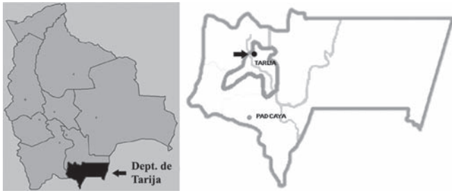
Figura 1. Mapa mostrando la ubicación de la localidad fosilífera en el Valle de Tarija. El yacimiento se indica con una flecha.

Map showing the fossiliferous locality within Tarija Valley. The arrow indicates the place where the fossil referred to Ciconia maltha was founded.