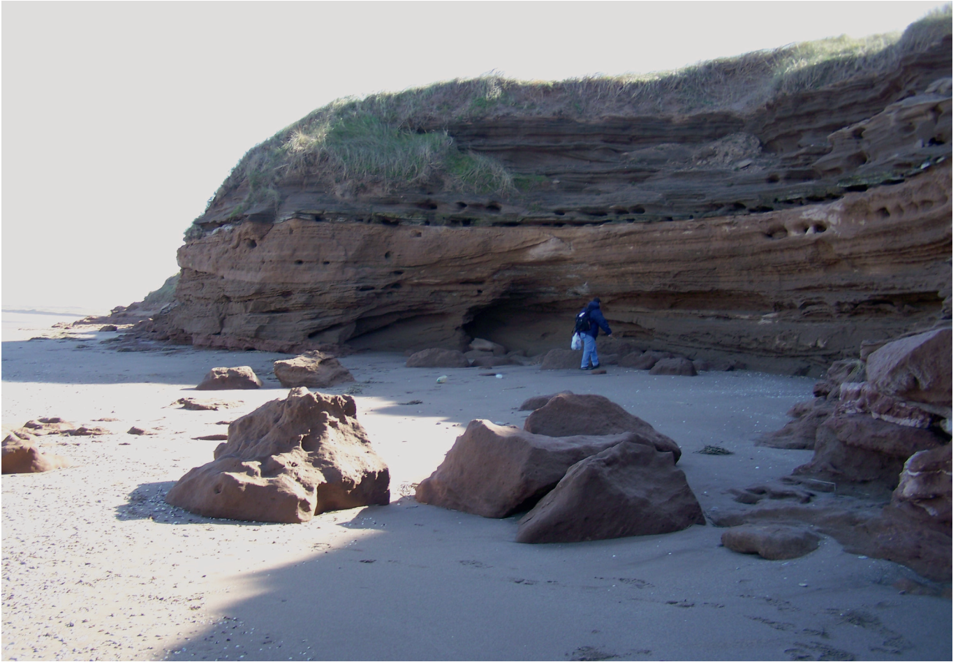
Figura 3. Barranca de Monte Hermoso. Monte Hermoso cliff.