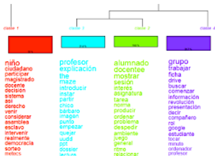
Figura 5. Dendrograma por clases del corpus textual.