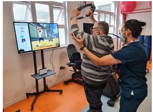
Figura 2. Sesión con videojuegos activos

inclinación, Elevación de rodillas, Sentadillas, Zancada con rotación, Inclinación lateral, Sentadillas con extensión, así como posturas de control inspiradas en Yoga como El guerrero, La silla y Luna creciente con giro. Además, se integraron dinámicas de desplazamiento como Equilibrismo, Balanceo troncal, Sendero del Corroteo, Guardia de los monstruos y Puente del Trote, que exigieron control dinámico, coordinación y esfuerzo aeróbico. La selección de estas actividades respondió a criterios de especificidad funcional, con el objetivo de estimular fuerza dinámica, flexibilidad funcional y control motor, en concordancia con los objetivos terapéuticos del estudio. La Figura 2 muestra el desarrollo de una sesión con VJA. Las características basales de los participantes se muestran en la Tabla 1 .