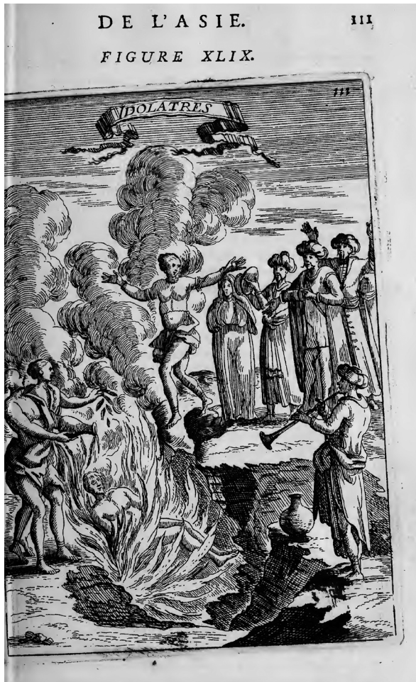
Imagen 5. Estampa correspondiente a la ceremonia del sati recogida en la Description de l'univers: contenant les differents systêmes du monde... , de Alain Manesson-Mallet publicada en París en 1683 (Manesson-Mallet, 1683: 111)