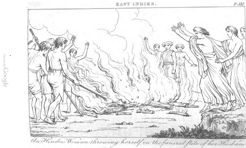
Imagen 6. Ilustración de la autoinmolación de una viuda perteneciente a la obra Geography, illustrated on a popular plan; for the use of schools and young persons, de Richard Phillips (1818: 536 bis)