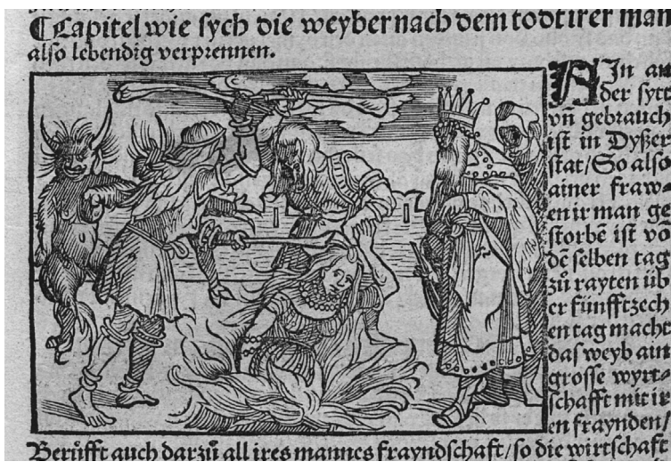
Imagen 1. Ilustración de la «quema de viudas» incluida en la edición alemana de los viajes de Ludovico Varthema, Die Ritterlich und lobwirdig rayß des gestrengen und über all ander weyt erfahren ritters und Lantfarers herren Ludowico vartomans... , publicada en Augsburgo en 1515 (Miller, 1515: fol. 51r)