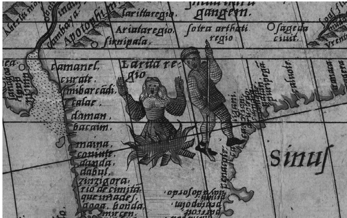
Imagen 4. Detalle de la miniatura incluida en el planisferio, de Sebastián Caboto de 1544