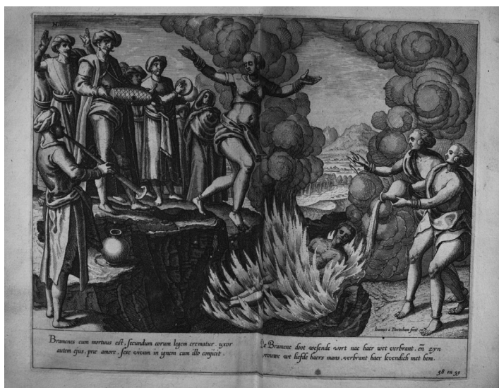
Imagen 2. Estampa sobre una escena de sati incluida en el Itinerario: Voyage ofte schipvaert van Jan Huyghen van Linschoten naer Oost ofte Portugaels Indien... , de Jan Huyghen van Linschoten, publicado en 1596