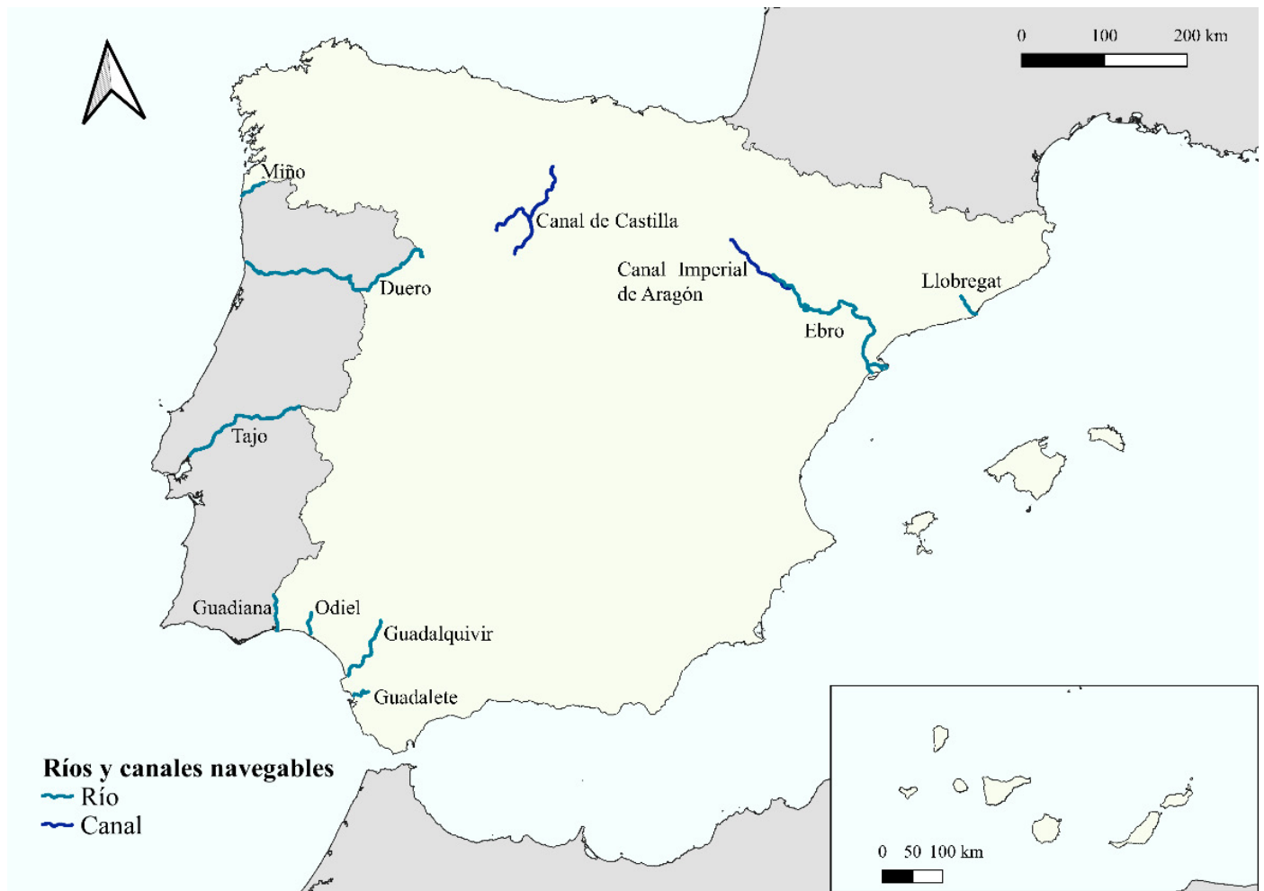
Figura 3. Ríos y canales navegables de España.