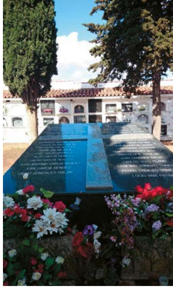
IMAGEN 3. Aspecto actual del panteón