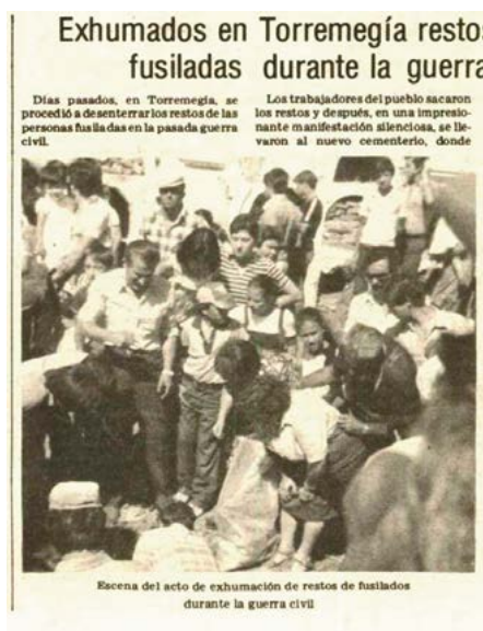
IMAGEN 2. Fotografía de la exhumación en Torremejía

víctimas mortales de la guerra civil» 55 . Ciertamente su partido, la ORT, mostró, al menos a nivel regional, una sensibilidad y una determinación mayores que otros a la hora de impulsar este tipo de iniciativas y, a juzgar por los testimonios recogidos en esta investigación, sus dirigentes parecían estar más concienciados con la reivindicación de la memoria de las víctimas, cuestión que entonces era tildada de radicalismo .