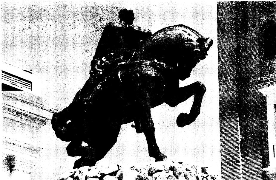
Estatua ecuestre, obra de Moisés de Huerta (1948), Academia General Militar de Zaragoza