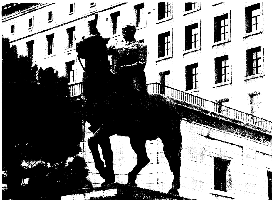
Estatua de José Capuz (1959), plaza de San Juan de la Cruz, Nuevos Ministerios, Madrid. Dos copias suyas fueron instaladas en Valencia y Santander en 1964