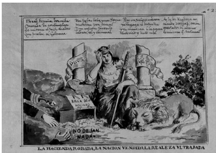
La Hacienda robada, la Nación vendida, la Realeza ultrajada . ¿1801-1807? Anónimo. Coleccionista privado.

El resultado de este despropósito moral denunciado por los fernandinos tenía una consecuencia política cuyo último responsable era Carlos IV: la ruina de una España aletargada, como podemos ver en La Hacienda robada , la Nación vendida y la Realeza ultrajada , una efectiva representación de la nación y del león de la monarquía, impasibles ante el expolio que están sufriendo.