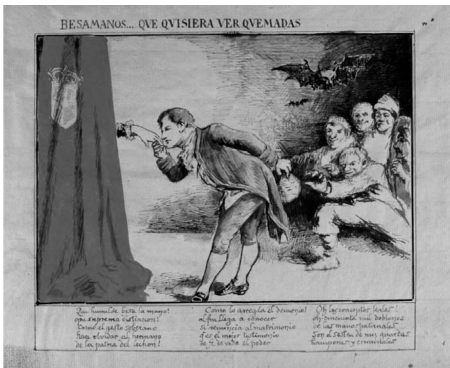
Besamanos... que quisiera ver quemadas, ¿1801-1807? Anónimo. Coleccionista privado.

El tercer protagonista, Carlos IV, es un mal rey por omisión. Estampas como No me importan lo que hacen ni harán, si me incomodo es por el qué dirán , o Mientras te vas de caza, en tu vedado otro entra representan el desgo-bierno del país por culpa de un soberano entregado a las intrigas de su mujer, lo que se puede apreciar también en varios de los versos de la colección: