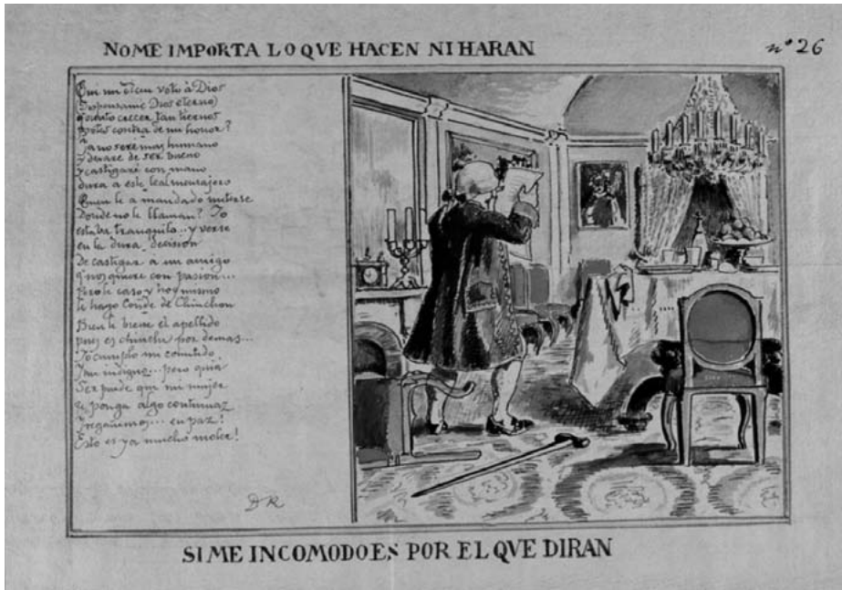
No me importa lo que hacen ni harán, ¿1801-1807? Anónimo. Coleccionista privado.

En la amenazante (108) estampa El juego es entre bribones y tontos, pero acabará pronto , vemos a la reina y a Godoy representados con los símbolos fálicos del basto y el chorizo, mientras que el rey está ausente y es sustituido por una especie de escudo de armas que incluye unos cuernos y la escopeta de caza (actividad que simboliza la despreocupación del rey por los asuntos del Estado y su alejamiento de la Corte). Aunque quizá la más ilustrativa de todas las obras sea Hasta el trono mancharon, y el deshonor de España consumaron que, si en su primera versión presenta a Carlos IV firmando documentos mientras Godoy y María Luisa flirtean, incluye una interesante novedad en la segunda: el brazo extendido de la reina, cuyo dedo índice ordena al rey que firme los papeles.