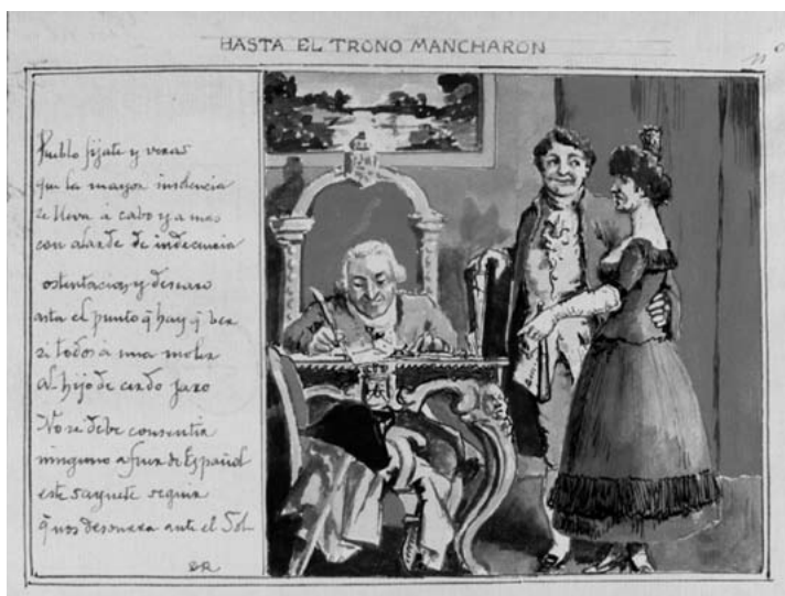
Hasta el trono mancharon, ¿1808-1809? Anónimo. Coleccionista privado.

El resultado de este despropósito moral denunciado por los fernandinos tenía una consecuencia política cuyo último responsable era Carlos IV: la ruina de una España aletargada, como podemos ver en La Hacienda robada , la Nación vendida y la Realeza ultrajada , una efectiva representación de la nación y del león de la monarquía, impasibles ante el expolio que están sufriendo.