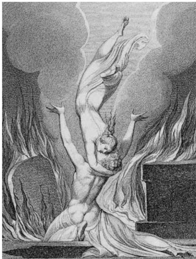
El reencuentro entre el cuerpo y el alma.

Última imitación relevante de este tipo de poesía y redactada por Lamartine en 1813. A la vuelta de un viaje a Florencia y Roma, en 1811, el poeta se retira a Milly y ocupa sus ocios escribiendo sus primeros versos ‘à l’ancienne mode’ del siglo XVIII, rimando elegías al estilo de Parny e influenciado por las incursiones en la literatura italiana e inglesa, sobre todo, que harán de él un poeta del siglo anterior más que del suyo propio: a pesar del triunfo de las Méditations en 1820, Lamartine se mantuvo siempre apartado de la nueva escuela romántica, ya que en materia de términos poéticos el vocabulario, formas y figuras que utiliza son los de generaciones anteriores –de ahí el envejecimiento de su poesía–; en cambio, si la retórica ha envejecido la música de sus alejandrinos sigue sonando maravillosamente: la combinación de las sonoridades que inventa está fuera de cualquier moda o tiempo. En esa época lee profusamente a Young y Gray en inglés, y en 1813 compone una epístola de trescientos versos 17 sobre las sepulturas, titulada del mismo modo; sin el influjo de los citados autores Lamartine no habría dado libre curso a sus fúnebres emociones en el marco elegido, ni tampoco habría dirigido su imaginación poética hacia la meditación soñadora, melancólica y religiosa a la vez. El poema del autor francés sería el último de este tipo, ya que la corriente inglesa se fundió e integró en la poesía romántica. Veamos el comienzo del poema original y su traducción castellana. 18