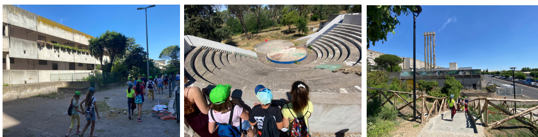
FIG. 6 / Deambulaciones hasta el teatro, la central térmica y el parque