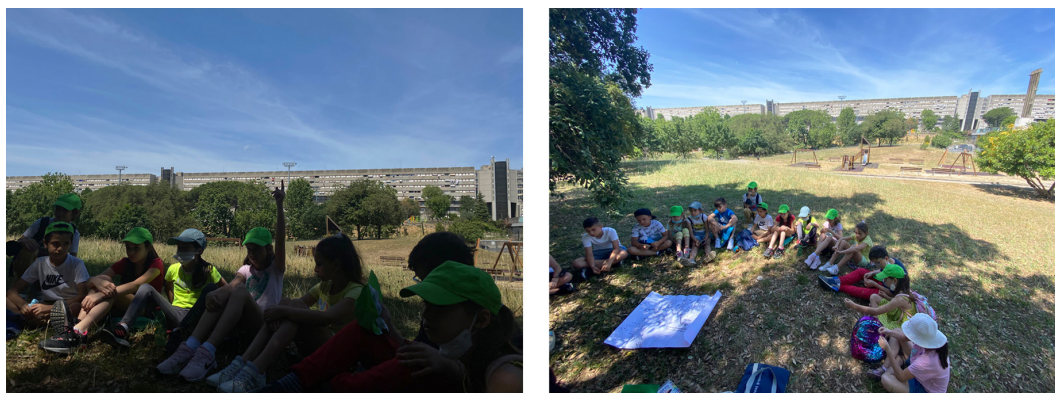
FIG. 7 / Fase de reflexión tras las deambulaciones en el parque