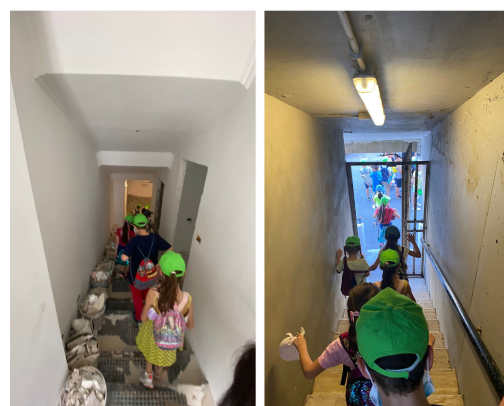
FIG. 5 / Atravesando el tiempo y el espacio del Corviale