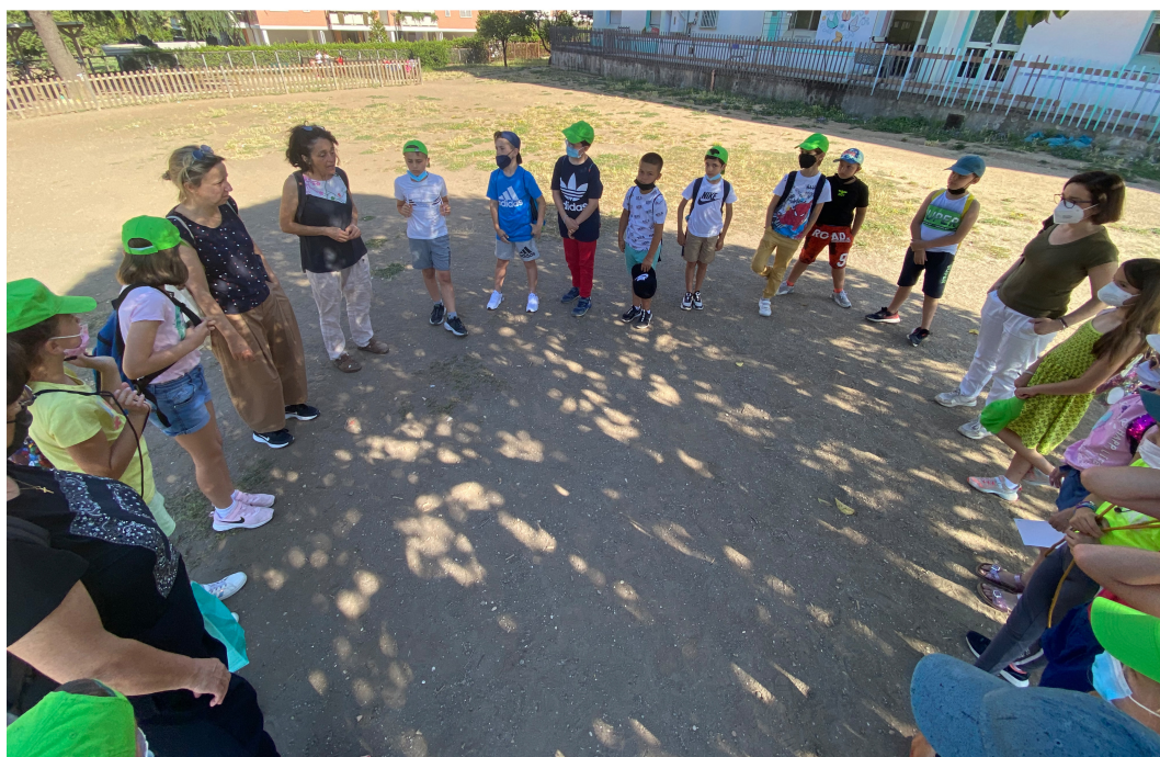
FIG 2 / Imágenes de la escuela I.C. Fratelli Cervi - Plesso Placido Martini, situada en Via della Casetta Mattei 269 de Roma el 8 de junio de 2022