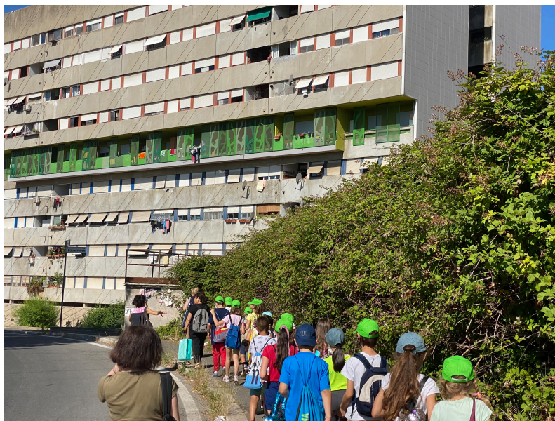
FIG 3 / Itinerario de escolares camino del Corviale

El grupo escolar a los pies del edificio Corviale observó la reciente intervención en el Piano Libero (FIG. 3) distinguiendo la nueva textura de la fachada. Se les explicaron las principales características arquitectónicas del complejo, y la necesidad de prestar servicios a sus habitantes. Se les introdujo en esta idea del Piano Libero como solución a las necesidades vitales y de convivencia, y se les explicó la situación que finalmente impidió su existencia.