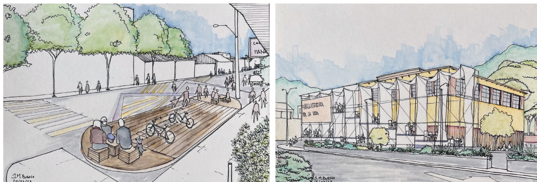
FIG. 2 / LEGO Parklets, prototipo multiprogramático flexible; e Instalación Activación Vertical plaza de Mercado de La Perseverancia