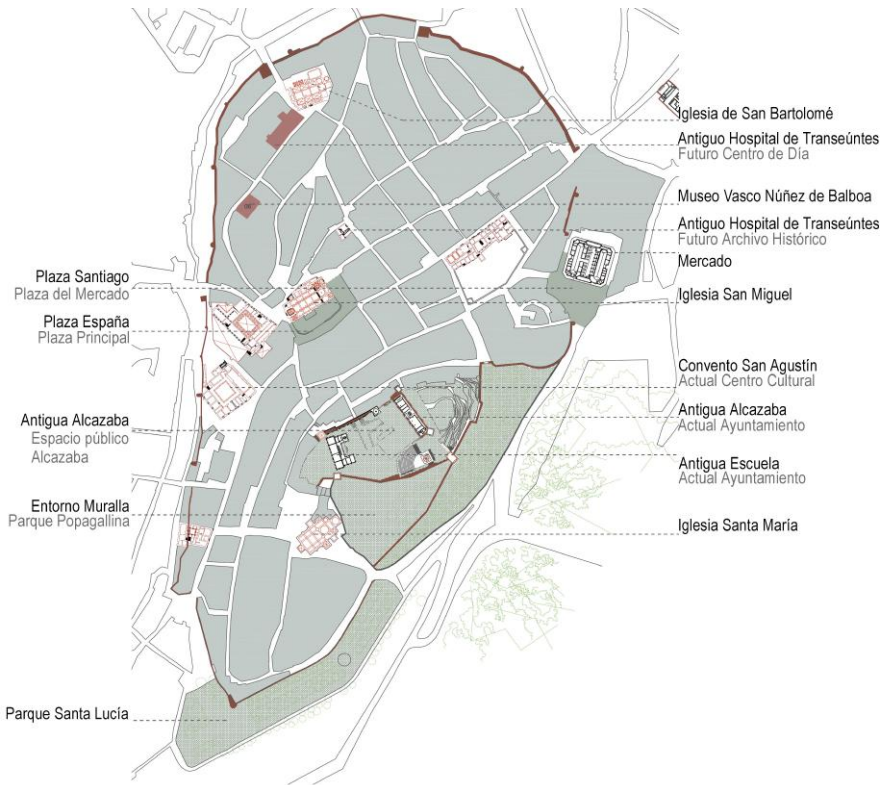
FIG.2./ Ámbito de aplicación del Plan de Accesibilidad de Jerez de los Caballeros -recinto amurallado- y ubicación de los edificios y espacios urbanizados singulares.

urbanizados (MINISTERIO DE VIVIENDA 2010); el tercero (02), se centra en completar la señalética y los elementos de protección; y por último (03), se trata de atender los recorridos secundarios y que se caracterizan por tener una pendiente superior al 12%.