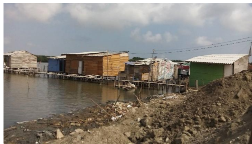
FIG. 1/ Ocupación de la ciénaga de Mallorquín por asentamientos informales en el barrio Las Flores.

En zonas aledañas a la ciudad de Barranquilla, en los últimos años, se han vuelto comunes los asentamientos informales. En el departamento del Atlántico hay unos 78.845 km 2 de terrenos con características de playa marítima y terrenos de tamar, pero aproximadamente 56.061 km 2 se encuentran ocupados a través de títulos de propiedad ineficaces y delimitados de manera irregular (JIMÉNEZ, 2019). En las zonas cercanas a la Ciénaga de Mallorquín en Barranquilla, correspondiente a un sector del barrio Las Flores, 300 familias viven en la informalidad. Las viviendas son construidas como palafitos, sin técnica o condición de habitabilidad (FIG. 1). Esta es la manera que muchas personas han encontrado de habitar una vivienda.