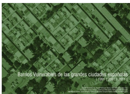
FIG. 1/ Portada de dos de las publicaciones derivadas de los Catálogos de Barrios Vulnerables de 1991, 2001 y 2011 en las que se analiza la vulnerabilidad en las ciudades mayores de 300 mil habitantes.