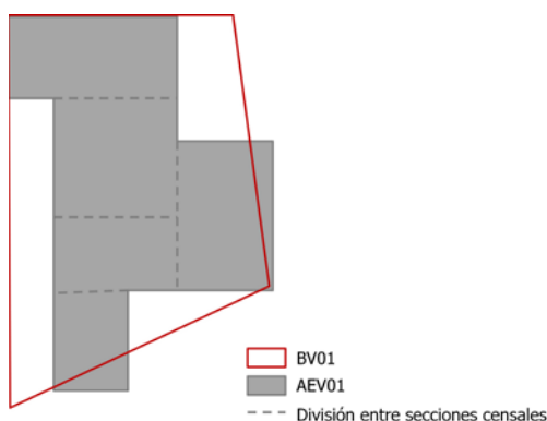
Fig. 3/ Representación esquemática de un Barrio Vulnerable (BV) y un Área Estadística Vulnerable (AEV).

se trata de un perímetro instrumental previo al trabajo de delimitación del BV y del que se obtienen los variables con las que se calculan los indicadores de vulnerabilidad. El BV es una delimitación urbanística de tejidos con homogeneidad morfológica y continuidad espacial (Fig. 3).