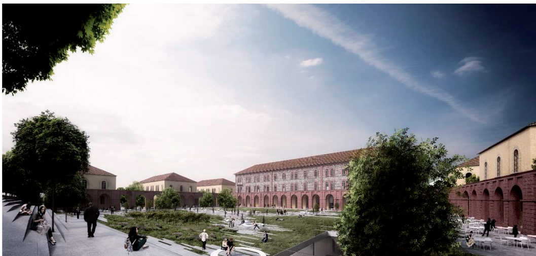
FIG. 2/ Escenario de regeneración propuesto para el cuartel La Marmora.