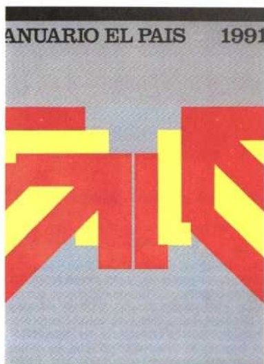
ANUARIO EL PAIS 1991. EDICIONES EL PAIS Madrid 1991, 28 x 20 cm, 464 págs.

Se cumplen con este número diez años de la aparición del primer ANUARIO EL PAIS en 1982, con lo que esta publicación entra ya en la categoría de «clásicos» al sumar a la información que ofrece (500 páginas con los hechos fundamentales del año, apoyados con estadísticas, cronología, documentación y opiniones), su propia historia como valor añadido que nos permite rastrear, comparar y comprobar datos y acontecimientos en este decenio repleto de cambios.