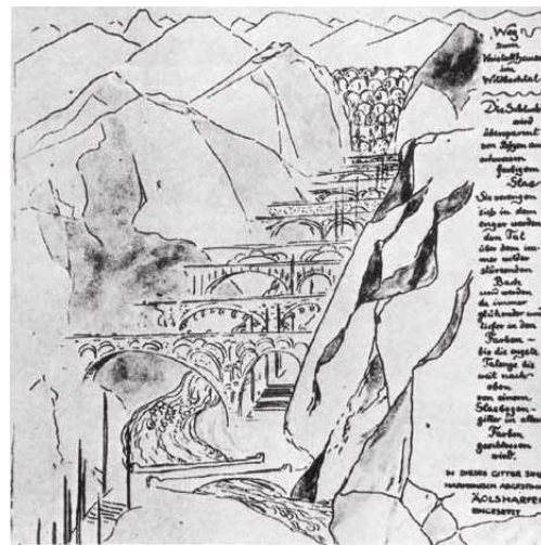
El dibujo, en color y en blanco y negro, es de Bruno Taut, y aparece en su libro Alpine Architektur , de 1917.