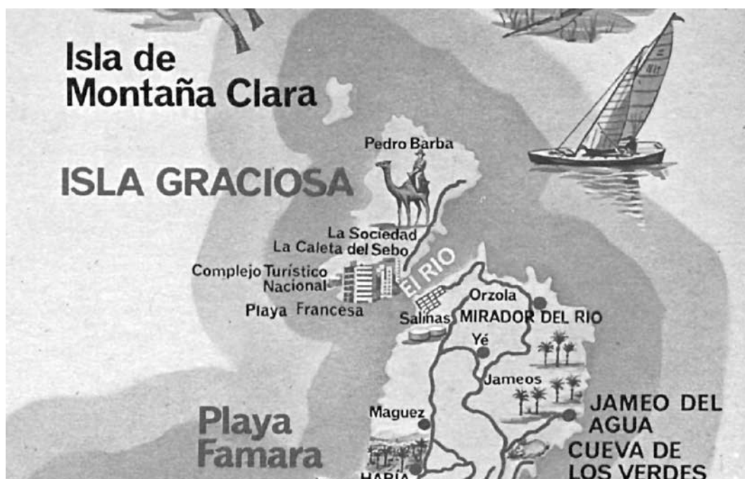
FIG. 1/ Fragmento de un mapa turístico de Lanzarote donde se puede apreciar la propuesta de Complejo Turístico Nacional en La Graciosa