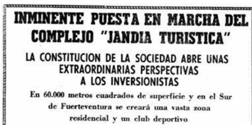
FIG. 3/ Noticia de carácter «publicitario» aparecida en el Diario La Provincia de fecha 6 de abril de 1968

Por tanto, puede afirmarse que los nuevos planteamientos en las estrategias de ordenación pública en materia turística son, en parte, resultado de la reacción frente al crecimiento cada vez mayor de dicha actividad. No obstante, la premisa siguió siendo la de promover la expansión del espacio turístico, incrementando la oferta alojativa orientada hacia el turismo de masas y captando inversiones para sufragar este proceso (ver FIG. 3).