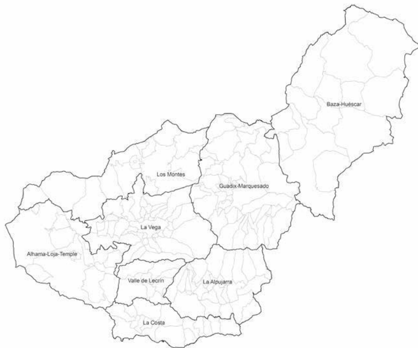
FIG. 2/ División comarcal de la provincia.