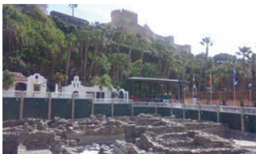
FIG. 5/ Unidad de paisaje tipo. Grupo A. Comarca de la Costa. Almuñécar: Yacimiento arqueológico fenicio. Castillo árabe. Jardín botánico del Majuelo

Es de destacar en el Grupo D, suelos urbanos comunes, intervenciones en espacios contemporáneos, la regulación de los vuelos y cuerpos volados de los edificios con el fin de evitar obstrucciones visuales en las unidades de paisaje de valor cercanas. Y las determinaciones para el diseño del espacio público que queda restringido a sólo tres modelos tradicionales: plaza, jardín y paseo-bulevar.