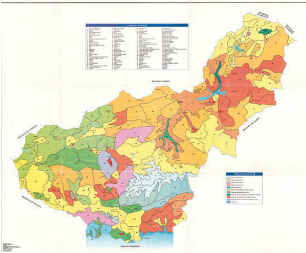
FIG. 4/ Unidades de paisaje en la provincia de Granada.

Conocidas estas preocupaciones, confirmadas las agresiones generalizadas al paisaje y analizados los trabajos profesionales de contenido temático arriba citados. La estrategia a seguir fue indagar a través del conocimiento; primero confeccionando una breve historia del paisaje, entendido como disciplina autónoma, en dónde se revisan, enfatizan y actualizan las aportaciones de los grandes autores; y segundo realizando un análisis sistemático de las disposiciones legales al respecto de ámbito europeo, nacional, y autonómico; en dónde se descubre la importancia del Convenio Europeo del Paisaje, las recomendaciones concretas de la Unesco y la vigencia aún de los textos legislativos urbanísticos de ámbito estatal; además de la legislación regional, sectorial y metropolitana. En dónde se reconoce el derecho al paisaje, el deber de su conservación como bien patrimonial, y el disfrute de su uso público y de su uso privado.