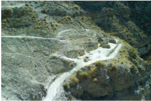
Fig. 7/ Unidad de paisaje tipo. Grupo C. Comarca de Baza-Huésca. Galera. Poblado ibérico

En el Grupo E, se regulan las intervenciones en suelos urbanizables sin desarrollar y los urbanizables comunes, ambos deberán ser revisados en la redacción del nuevo planeamiento, en cuanto a su clasificación y categoría; y transitoriamente quedan reconocidos los dos como Suelos de Hábitat Rural Diseminado. En los dos casos se realizará inventario de los elementos de valor: hitos, cimas, valles, caminos, sistema hídrico, arbolado, parcelación histórica y caserío, los cuales deben ser preservados del proceso urbanizador, e integrados, en el caso de suelos urbanizables, en el desarrollo urbano futuro.