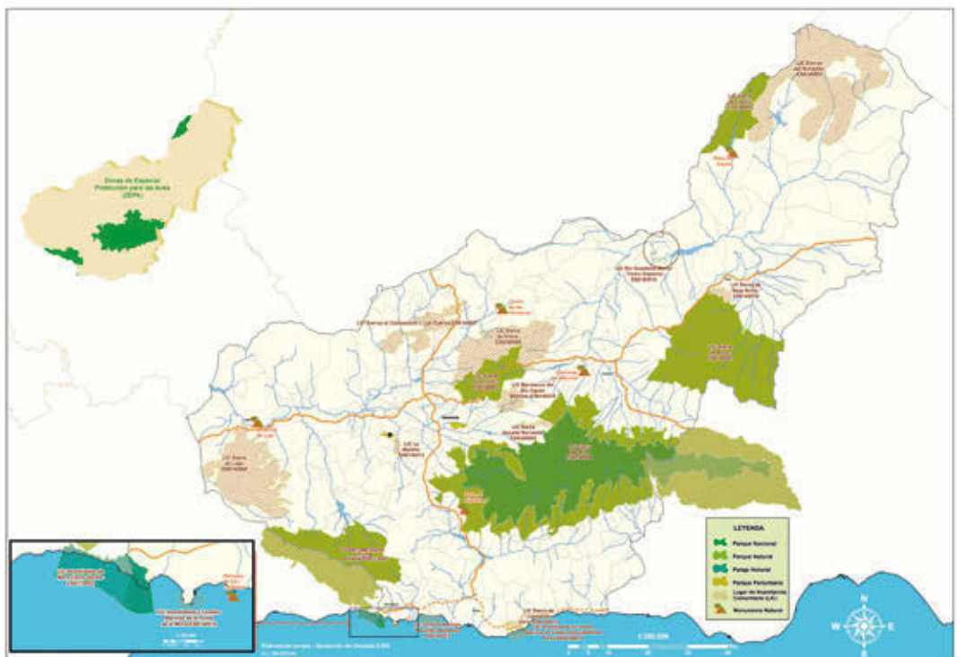
FIG. 3/ Espacios Naturales Protegidos de la Provincia de Granada.