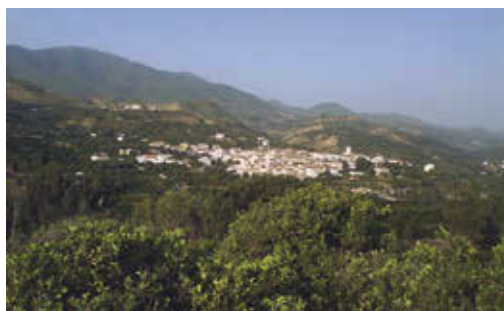
FIG. 6/ Unidad de paisaje tipo. Grupo B. Comarca del Valle de Lecrín. Naranjales al pie del Parque Nacional de Sierra Nevada