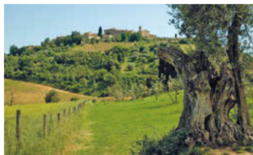
FIG. 5/ Paisaje de cultivos mixtos