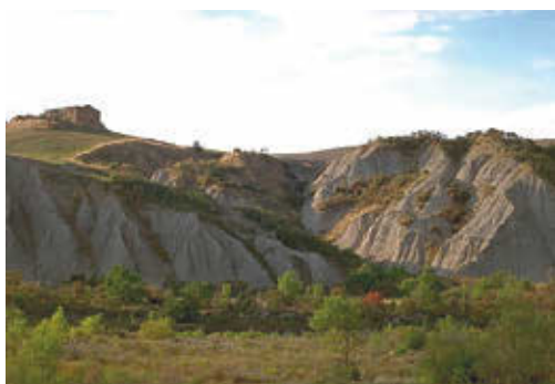
FIG. 2/ Fragmentos de paisajes naturales: calanchi y biancane

Su paisaje está conformado en su mayor parte por aquel mare di Creta 2 descrito por los peregrinos de la Edad Media que recorrían el valle por la vía Francigena que lo atraviesa longitudinalmente en su camino hacia Roma. Esta evocativa definición encuentra su fundamento en la morfología del territorio, caracterizado por una sucesión de relieves de colinas compuestas por arcillas pliocenas y marcadas por las profundas incisiones provocadas por cauces de agua y por «barrancos» y las características biancane 3 (FIG. 2), formaciones erosivas conectadas a sustratos arcillosos, pero que en nuestros días han quedado reducidas a fragmentos aislados después de siglos de recuperación del territorio para usos agrícolas. Los relieves de Montalcino, por su parte, están caracterizados por colinas arenosas y pedregosas y por paisajes de masas arbóreas con predios muy compactos. De ello se desprende que el Valle del Orcia está articulado en torno a dos sistemas ambientales principales: el sistema de las «Colinas Pliocenas», con el subsistema de las Cretas sienesas al norte y, al sur, el de las Cretas del Valle del Orcia; y el sistema de los «Relieves del Anteapenino» con el subsistema de los Relieves de Montalcino y el subsistema del «Cono volcánico».