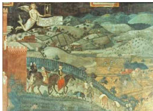
FIG. 3/ A. Lorenzetti (1338) Effetti del Buon Governo sulla Città e sul Contado, Palazzo Pubblico di Siena

raciones principales, a saber, los pastos y sembrados desnudos (FIG.4) y los cultivos mixtos y preferentemente arbolados (FIG. 5), remontándose ambas al sistema mezzadrile 4 introducido en la Toscana entre los siglos XIV y XV.