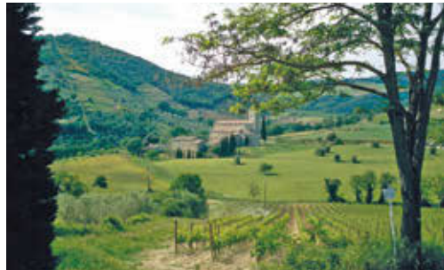
FIG. 6/ Abadía De San'antimo

6), de villas y podere 6 , igualmente situados en posición elevada. También encontramos antiguos hospitales, casas de postas y albergues para los peregrinos y comerciantes a lo largo de la densa red de recorridos históricos que asimismo todavía es claramente legible sobre el territorio (FIG. 7).