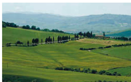
FIG. 4/ Paisaje de sembrados desnudos