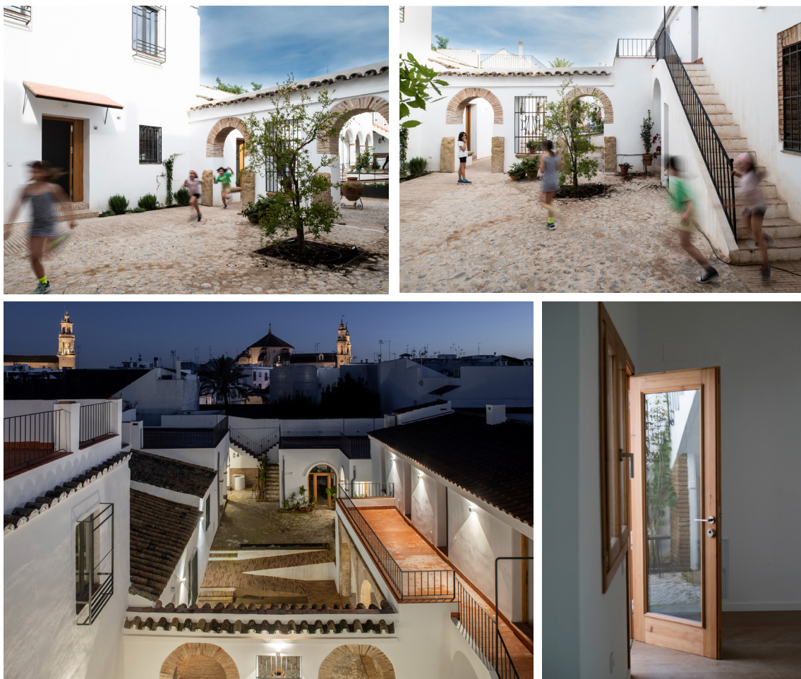
FIG. 6, 7, 8 Y 9. Imagen de la casa tras la intervención.