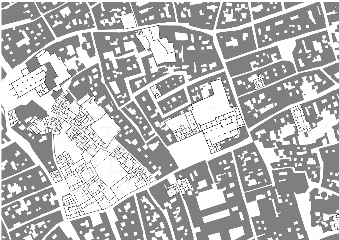
FIG. 3. Mapa urbano de la relación entre morfología y tipología de la casa-patio

Patrimonio Histórico de la Consejería de Cultura y Patrimonio Histórico de la Junta de Andalucía, que se centra en el análisis y desarrollo de metodologías participativas relacionadas con varios ámbitos de la gestión patrimonial 11 . Su equipo ha participado activamente en el proyecto de investigación “La guía para la acción de un recurso patrimonial en los ODS” (GARPODS), coordinado por Universidad de Córdoba y financiado por la Consejería de Fomento, Articulación del Territorio y Vivienda de la Junta de Andalucía