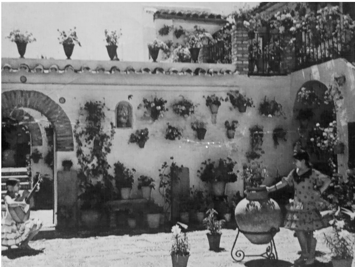
FIG. 4. Imagen histórica de la casa de Montero 12, primera casa rehabilitada por la iniciativa