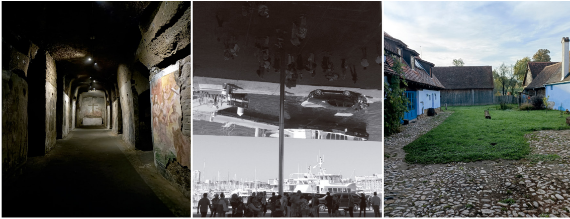
FIG. 1. Las Catacumbas del Rione Sanità (Nápoles), marquesina del Puerto Viejo (Marsella), Casa patio en Viscì.