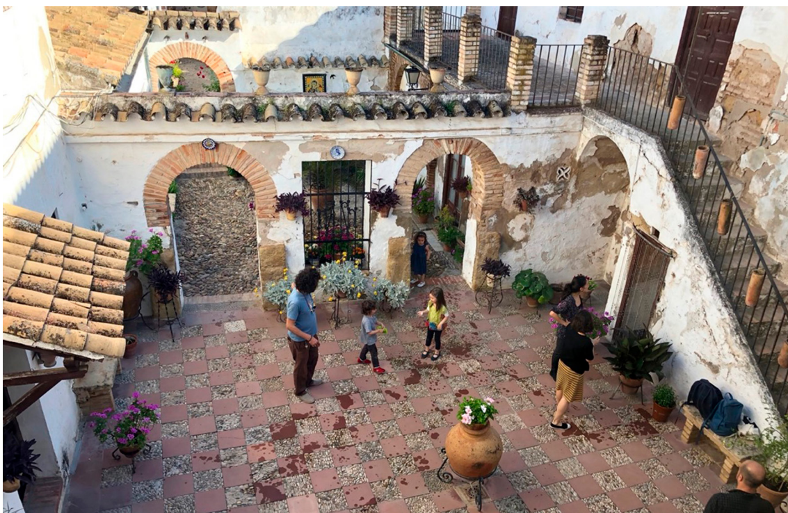
FIG. 5. Imagen de la casa y los cooperativistas antes de la intervención