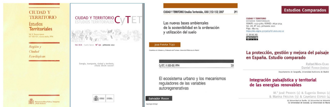
Fig. 5 / Monográficos y artículos destacados dedicados a temas ambientales