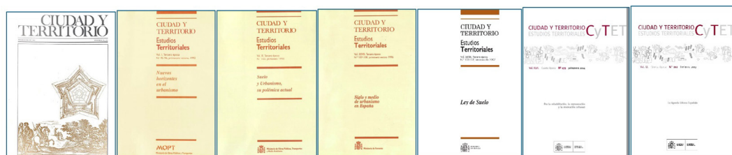
Fig. 4 / Portadas de números especiales dedicados al debate sobre legislación de urbanismo y suelo en España. De izquierda a derecha: CyT n.º 59-60, CyTET n.º 95-96, n.º 103, n.º 107-108, n.º 152-153, n.º 179 y n.º 202