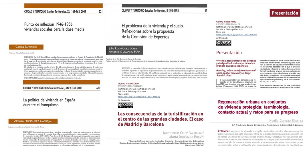
Fig. 6 / Un recorrido a través de las páginas de CyTET por la política de vivienda en España desde el franquismo hasta algunos retos actuales como la turistificación de las ciudades o la regeneración urbana