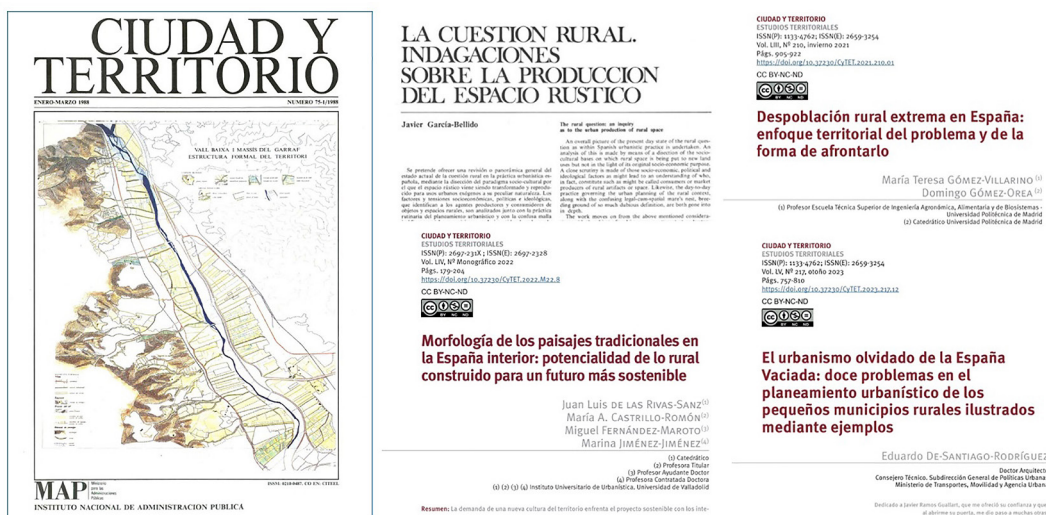
Fig. 2 / Ejemplos del monográfico (CyT n.º75 de 1988) y de varios artículos dedicados a los espacios rurales y su ordenación