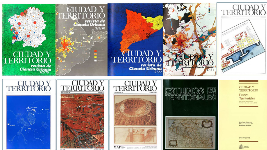
FIG. 3 / Un recorrido por las portadas de algunos monográficos dedicados a la ordenación territorial y urbana de diversos ámbitos geográficos. Arriba: Galicia (CyT n.º 23-24), Madrid (CyT n.º 28-29), Cataluña (CyT n.º 32-33), Madrid (CyT n.º 50), Cantabria (CyT n.º 62). Abajo: Francia (CyT n.º 72-73), Canarias (CyT n.º 77), Pirineos (Estudios Territoriales n.º 29) y Brasil (CyTET n.º 145-146)