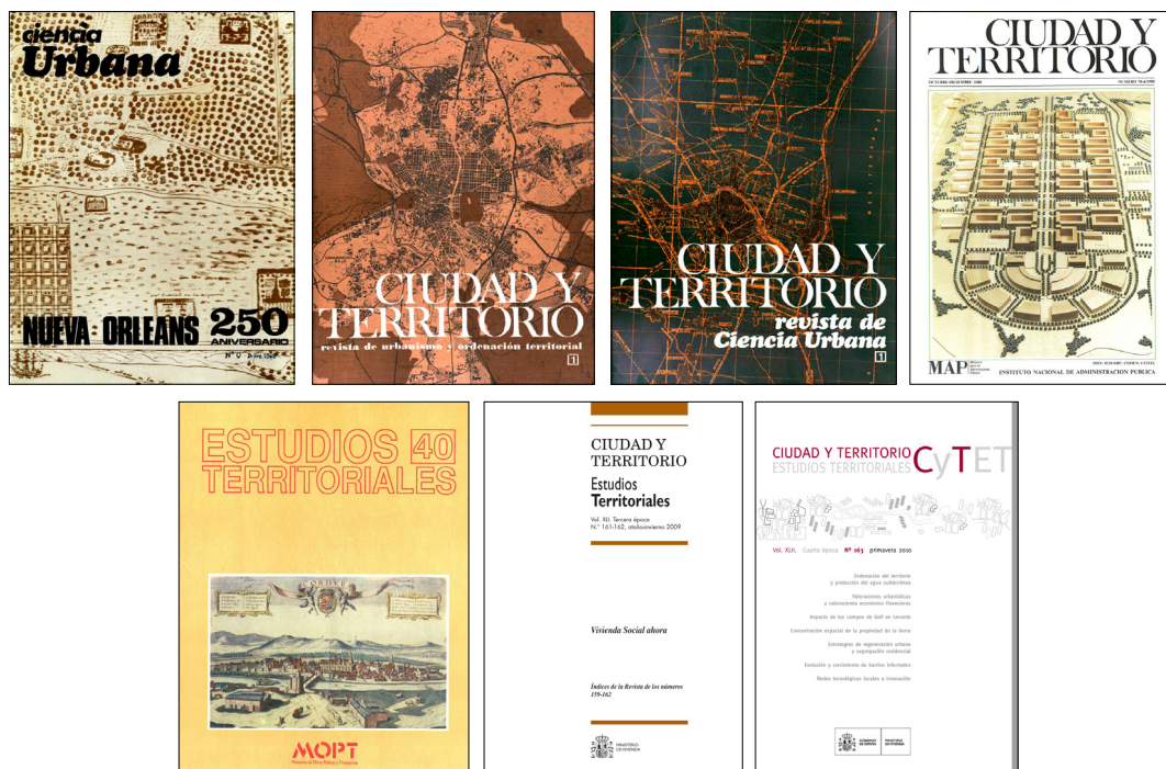
FIG. 1 / Cabeceras de las distintas revistas integradas en CyTET a lo largo de sus diferentes épocas. De izquierda a derecha: n.º 0 de Ciencia Urbana (1968-1969); n.º 1 de Ciudad y Territorio. Revista de Urbanismo y Ordenación Territorial (1969); n.º 1 de Ciudad y Territorio, Revista de Ciencia Urbana (1970-1983); n.º 78, ejemplo de la Segunda Época de Ciudad y Territorio (1984-1992); n.º 40, último de Estudios Territoriales (1981-1992); n.º 161-162, último de la Tercera Época de CyTET (1993-2009); n.º 163, primero de la Cuarta Época de CyTET (2010-2024)